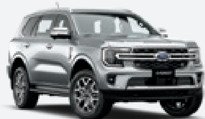
Alumínio Metalizado 1