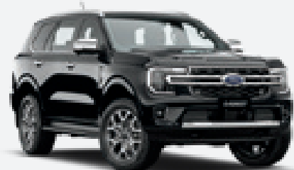
Absolute Black Metalizado 1