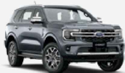
Meteor Grey Metalizado 1