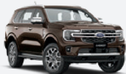
Equinox Bronze 1