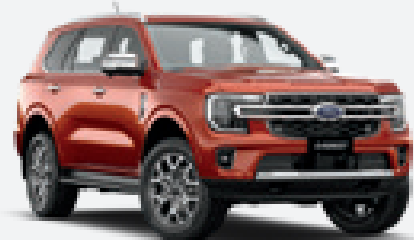
Sedona Orange 1